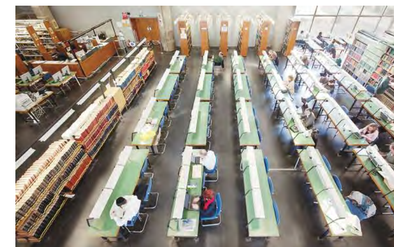
Sala de lectura de la Biblioteca Nacional de Israel

En las “cajas de libros” se puede encontrar todo tipo de literatura, y los libros se ofrecen en cinco lenguas: hebreo, árabe, inglés, francés y ruso. También hay literatura infantil en el catálogo. A pesar de la fuerte competencia con los videojuegos, en Israel sigue floreciendo el mercado literario para niños y jóvenes.