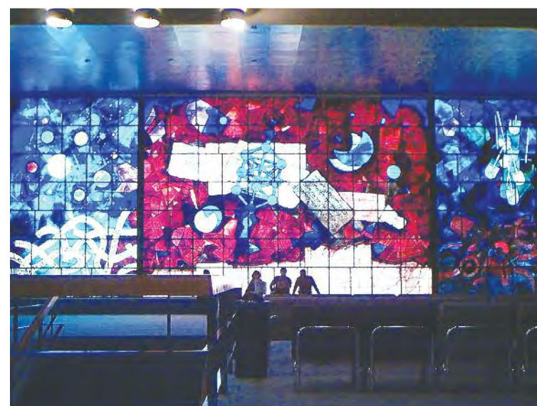
Vitrail de Mordejai Ardon en la Biblioteca Nacional de Israel

Incluso antes del momento de la liberación, todavía inmersos en el período más oscuro de la historia de la humanidad, hubo personas que se esforzaron en documentar y