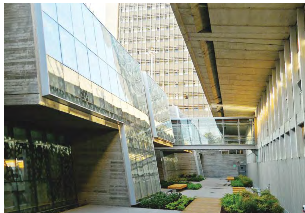
Biblioteca de la Universidad de Haifa

Culturalmente hablando, uno de los lugares más importantes de Tel Aviv es el Centro de Estudios de Israel Itzjak Rabin, que se ubica en una colina con una vista panorámica del Parque Hayarkón, cerca del Museo Eretz Israel, el Museo del Palmaj y la Universidad de Tel Aviv.