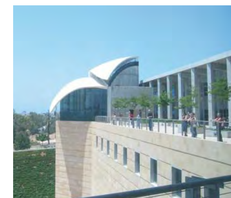
Centro de Estudios de Israel Itzjak Rabin

Este dúo cree que las bibliotecas de las paradas de autobús podrían ser un lugar para reciclar material de lectura que ocupa espacio en las estanterías de los hogares y en los sótanos de las bibliotecas públicas. Y no se equivoca. Por ejemplo, en la parada de autobús más cercana al Tejón los estudiantes intercambian sus tesis y libros de ciencia ficción. En un barrio ultraortodoxo, los residentes intercambian