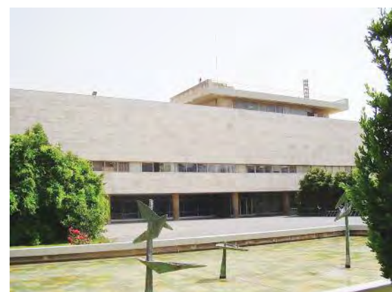
Biblioteca Nacional de Israel

El centro ofrece una visita guiada para conocer de cerca la historia del lugar, así como la vida del mítico primer ministro. El museo se pasea por la historias de principio del siglo XX para conocer el proceso