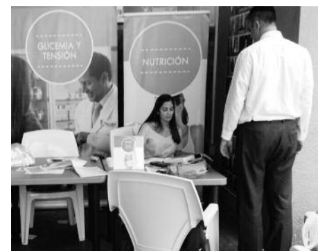
Asesoría nutricional en la Jornada de Locatel