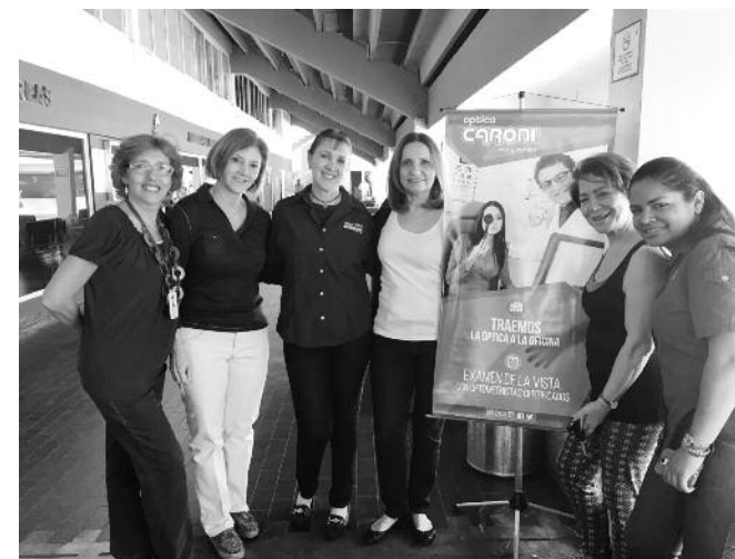
Jornada Visual de Óptica Caroní

Entre el 14 y 18 de marzo, de 8 am a 12 m, la Unidad Clínica Móvil de la Sociedad Anticancerosa de Venezuela estuvo estacionada frente a la enfermería de Hebraica para atender a más de 132 personas, entre miembros de la comunidad y personal del centro social, en el ope-